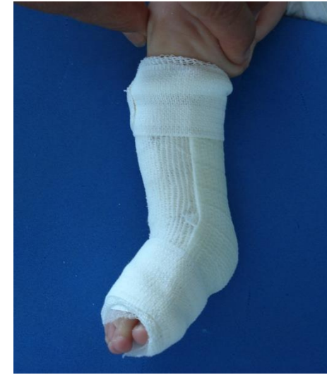
Replacer le pied et solidariser à nouveau la partie postérieure avec des Tensoplasts