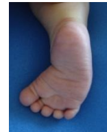
Le Pied Metatarsus Varus

Votre enfant est porteur d'une déformation du pied. Une botte en résine a été mise en place. L'objectif de cette résine est d'immobiliser la cheville et le pied en position corrigée pour étirer les structures musculo-tendineuses. Cette contention, confectionnée sur un bandage pré-correcteur, est une contention thérapeutique qui nécessite une surveillance étroite.