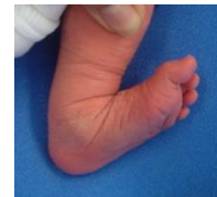
Le Pied Supinatus