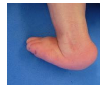
Le Pied Convexe