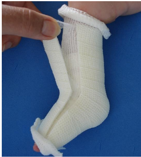
Enlever les Tensoplasts