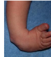
Le Pied Bot Varus Equin