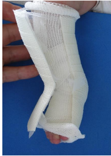
Enlever la partie antérieure de la résine