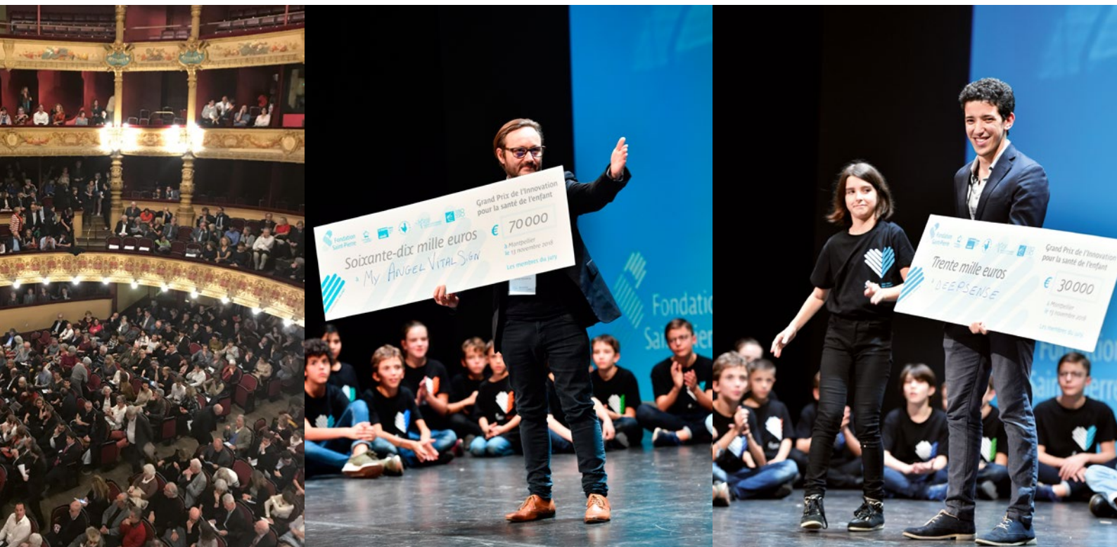
L'Opéra Comédie a accueilli la cérémonie de remise du premier Grand Prix de l'Innovation pour la Santé de l'Enfant, dont les lauréats sont Devinnova (MyAngel VitalSigns) et Deepsense.

la modernisation de ses équipements. « Nous avons construit un nouvel hôpital qui était indispensable pour donner une plus grande qualité de soins » juge le président. L'Institut Saint-Pierre est aujourd'hui le plus important de France pour les suites de soins et la réadaptation en pédiatrie.