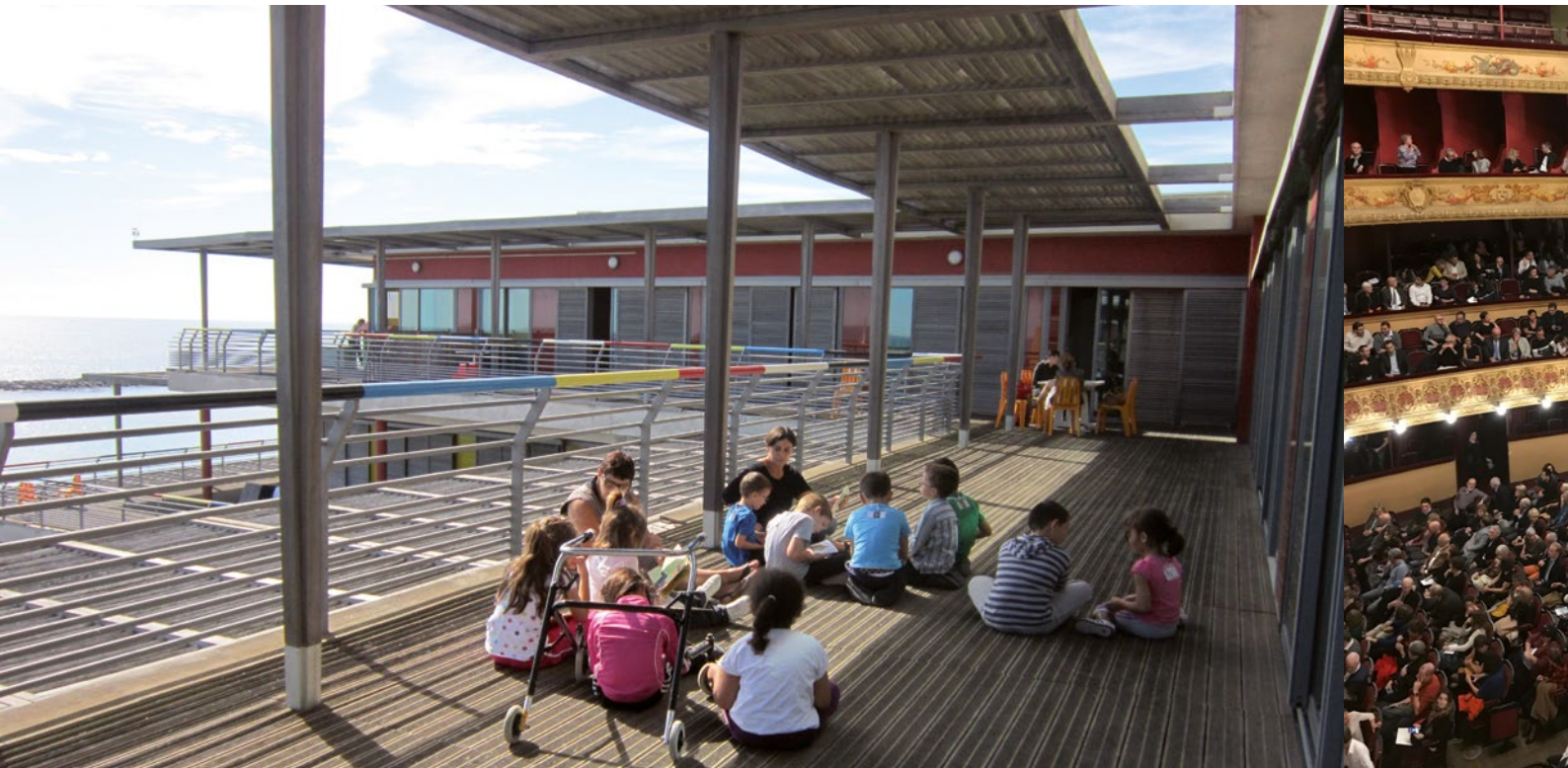
Les enfants face à la mer, dans le cadre privilégié de l'Institut Saint-Pierre.